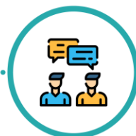
Îngrijire medicală ajustată discutată cu dumneavoastră

Dacă vă îmbolnăviți de COVID-19 după operație, echipa medicală a spitalului va lua în considerare riscul dumneavoastră crescut datorat intervenției chirurgicale recente și vă va oferi îngrijiri medicale pentru a asigura recuperarea dumneavoastră atât din punct de vedere chirurgical, cât și infecțios.