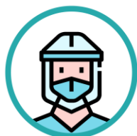
Complet echipat cu PPE