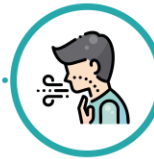
Dificultăți de respirație