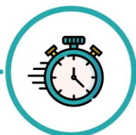
Proceduri adaptate pentru a reduce timpul de expunere