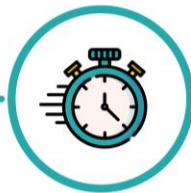
Procedimientos adaptados para reducir tiempo de exposición