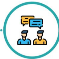
Atención ajustada discutida contigo

Si desarrollas COVID-19 después de la operación, el personal considerará tus riesgos más elevados por tu reciente cirugía y te darán los cuidados adecuados para tu recuperación tanto de la cirugía como de cualquier infección.