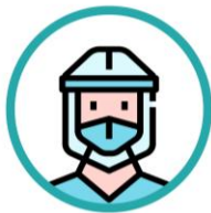
Equipo completo EPI