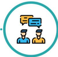
Atención ajustada discutida contigo

Si desarrollas COVID-19 después de la operación, el personal considerará tus riesgos más elevados por tu reciente cirugía y te darán los cuidados adecuados para tu recuperación tanto de la cirugía como de cualquier infección.